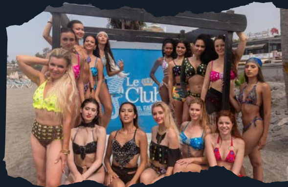
Semana de la Moda de Nueva York