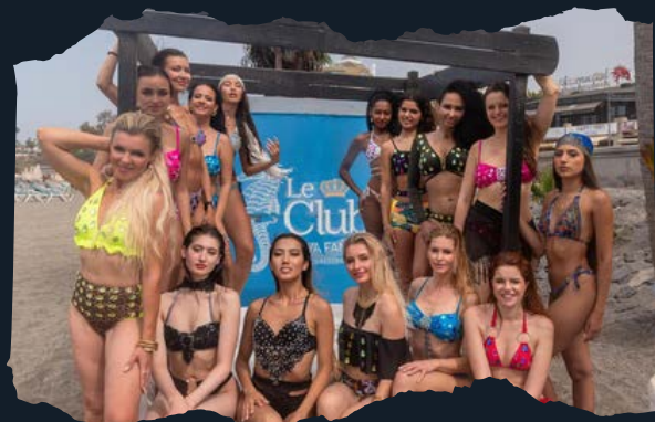
Fashion Week de New York